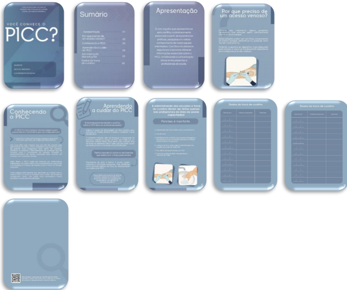
Figura 2 – Projeto gráfico da cartilha proposta. Fortaleza, Brasil, 2024.